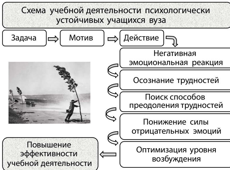
Рис. 1. Схема учебной деятельности психологически устойчивых учащихся вуза