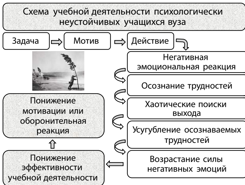
Рис. 2. Схема учебной деятельности психологически неустойчивых учащихся вуза