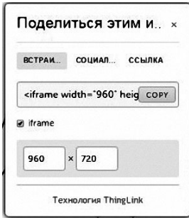
Рис. 3. Окно для получения html-кода на thinglink.com

одновременно произвести видеозапись презентации и лектора на общее поле. Такое средство обучения подходит для представления порядка выполнения лабораторной работы или консультации по решению задач, или ещё по каким-то вопросам, не требующим длительного изложения. При просмотре записи (она будет храниться на сервисе), пользователь имеет возможность варьировать соотношение размеров полей презентации и преподавателя. После создания записи, для получения доступа к записи html-кода следует активировать левую пиктограмму из приведённых на рис. 1.