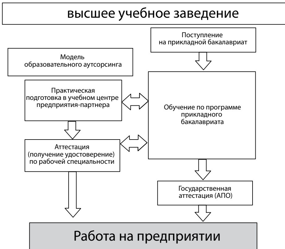
Рис. 1. Организационная модель образовательного аутсорсинга при реализации прикладного бакалавриата

Вторая модель — это создание образовательной инфраструктуры на основе горизонтальной кооперации между автономными учреждениями профессионального образования и отраслевыми предприятиями. Субъекты инфраструктуры создаются как на базе учреждения профессионального образования, так и на базе отраслевого предприятия. К ним относят: отдельные рабочие места; мастерские, лаборатории, филиалы,