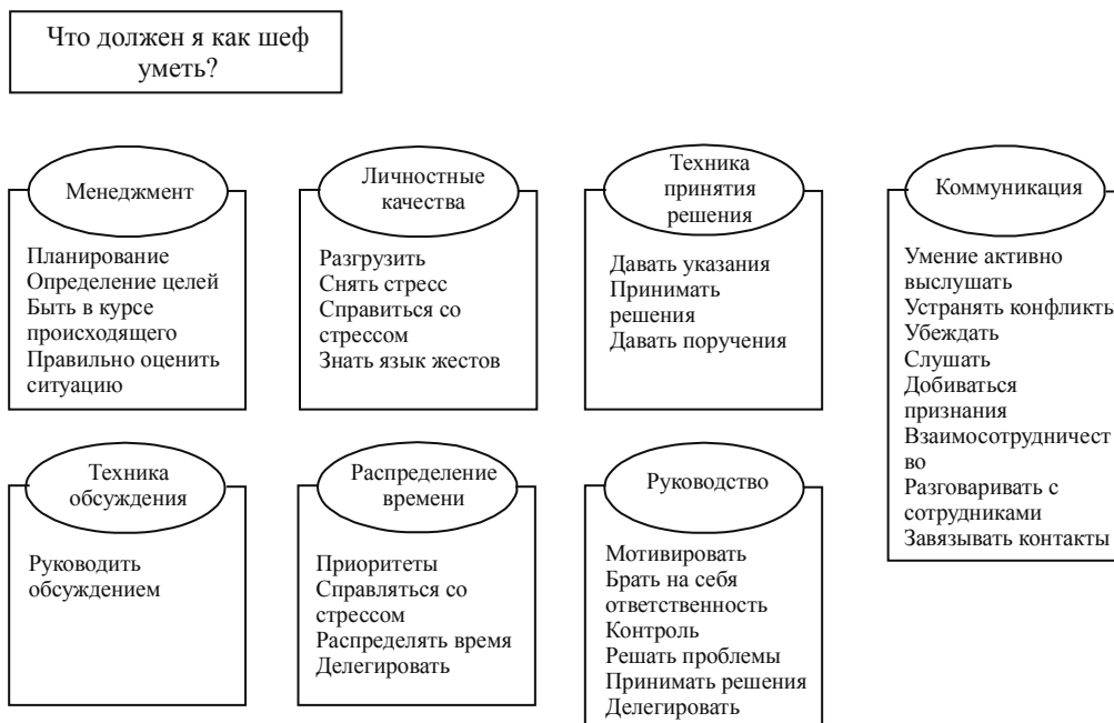
Рис. 3. Предлагаемые темы обучения

кими качествами должен обладать современный преподаватель?». Необходимо назвать по 7 качеств с точки зрения администрации, родителей, обучающихся, преподавателей. Из числа участников создаются четыре одноимённые группы, которые в ходе обсуждений вырабатывают качества педагога с позиции своей группы. Данные дискуссии представлены в таблице 2 (стр. 132).