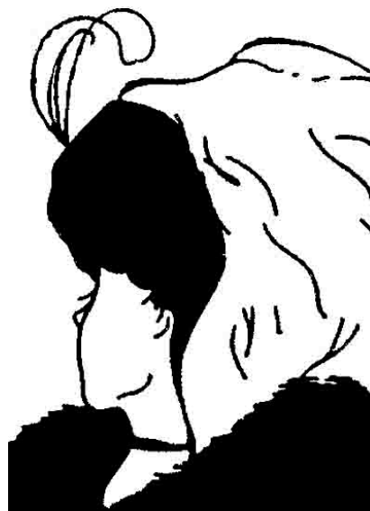
Рис. 1. Кто изображён на картинке: старуха или молодая женщина?

Будучи элементом конструирующего механизма мозга, восприятие не всегда точно отражает мир, что проявляется в ошибках или иллюзиях (рис.1, 2).