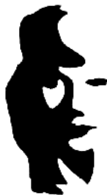
Рис. 2. Что вы видите: лицо девушки или саксофониста?