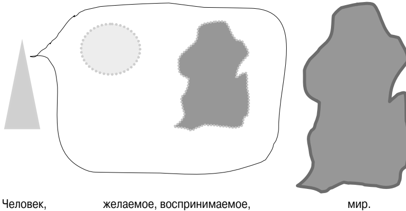
Рис. 2. Содержание экрана сознания